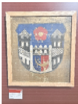
Altes Wappen Horn im Burgmuseum

Neben geladenen Gästen sind auch alle Bürgerinnen und Bürger herzlich eingeladen, der Feierstunde beizuwohnen, die um 11.15 Uhr in der Burgscheune beginnt.